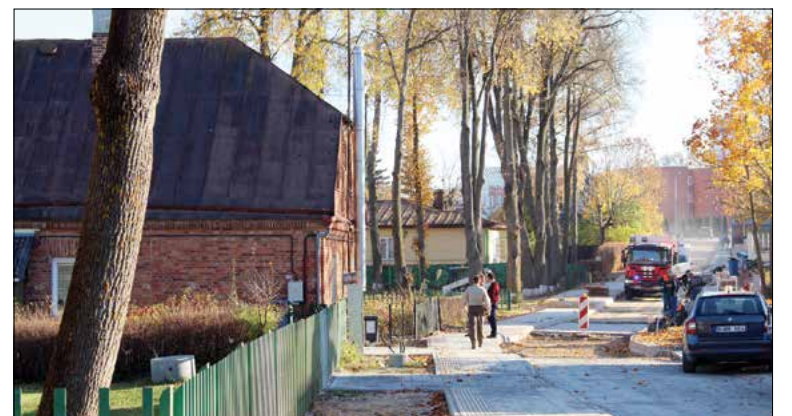
Kvietimas į Sodų gatvę nepasitvirtino.