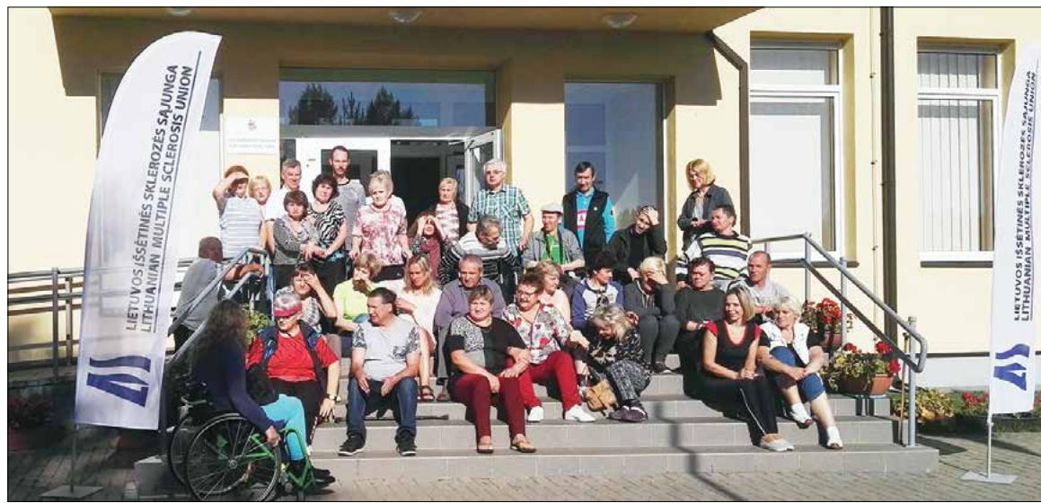
Vepriuose stovyklavo per 60 išsėtine skleroze sergančių žmonių, juos palydėjusių artimųjų bei medicinos slaugytojų.

Kitas ne mažiau svarbus tikslas – kuo plačiau skleisti informaciją apie šią ligą, simptomus, kad sergantys žmonės susivoktų