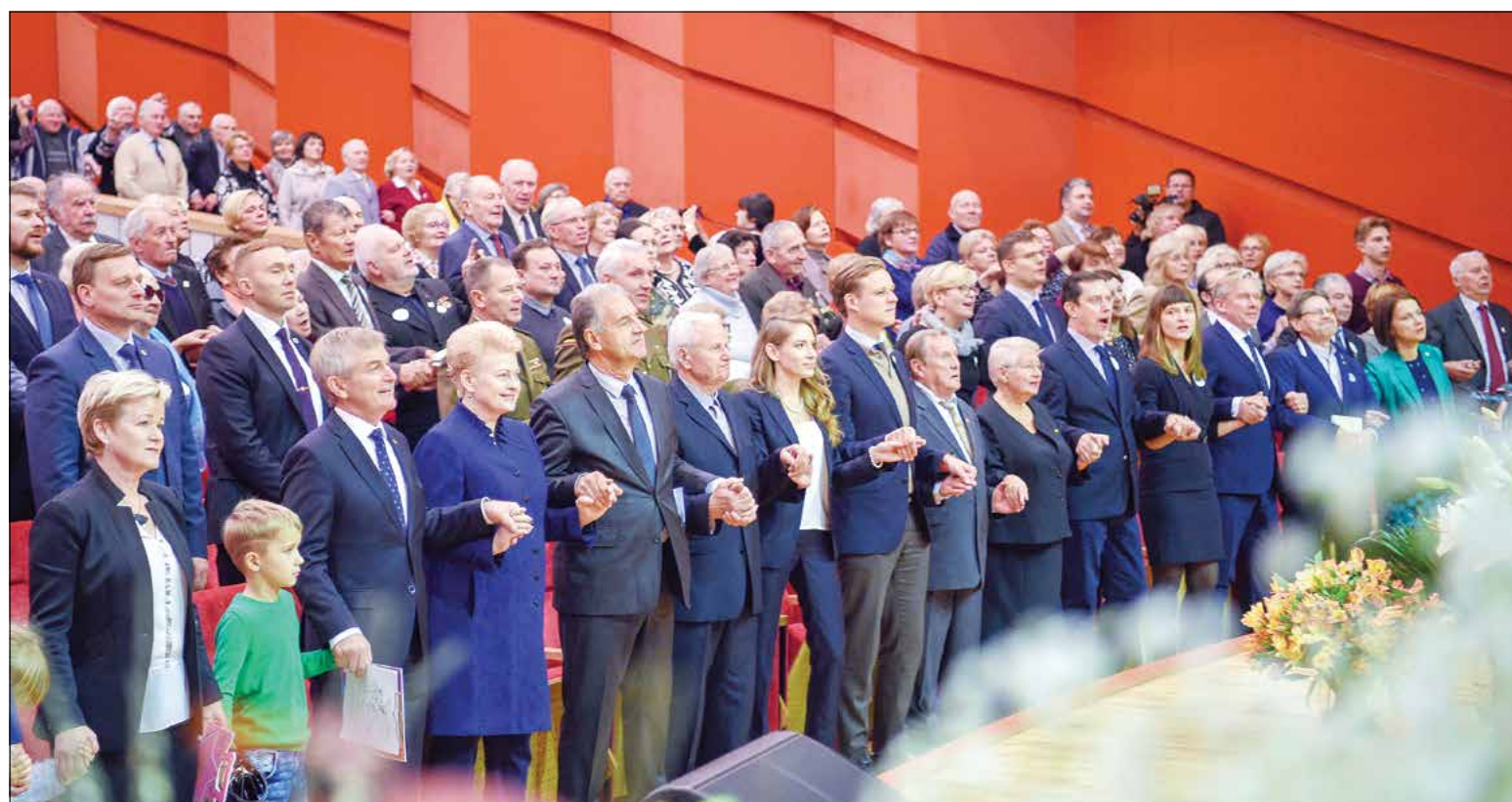
Jubiliejų švenčiančios patriotinės organizacijos narius pagerbė daug garbių svečių.