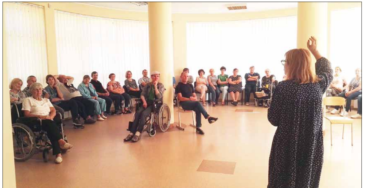
Stovyklautojams organizuota įvairi veikla.