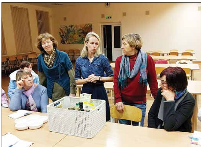
Užsiėmimų metu dalyviai mokėsi sveiko maisto gamybos subtilybių.

klos tikslas – formuoti senjorų ir neįgaliųjų asmenų sveikos gyvenimo vertybines nuostatas bei skatinti jų amžiui priimtina fizinį aktyvumą. Organizatoriai sulaukė šiltų dalyvių atsiliepimų.