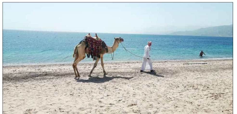
Norintys gali pajūriu pajodinėti kupranugariais.