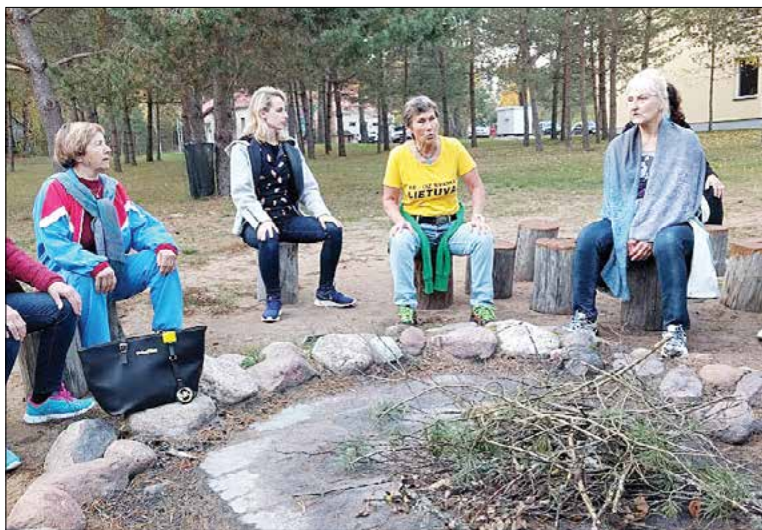
Stovyklavimo metu vyko įdomūs pašnekesiai.