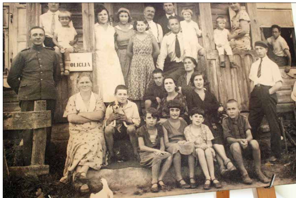
Archyvinėje nuotraukoje – ukmergiškiai pareigūnai su šeimomis.