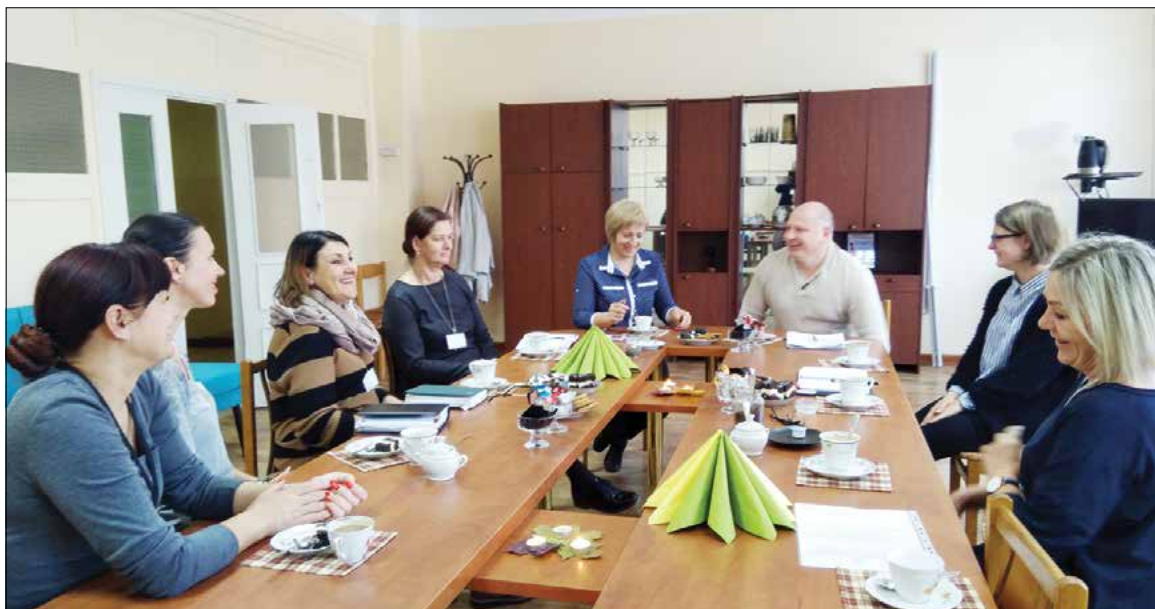
Pasitarimas vyko Globos centre.