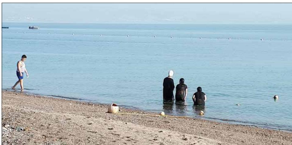
Vietinės moterys maudosi su drabužiais.