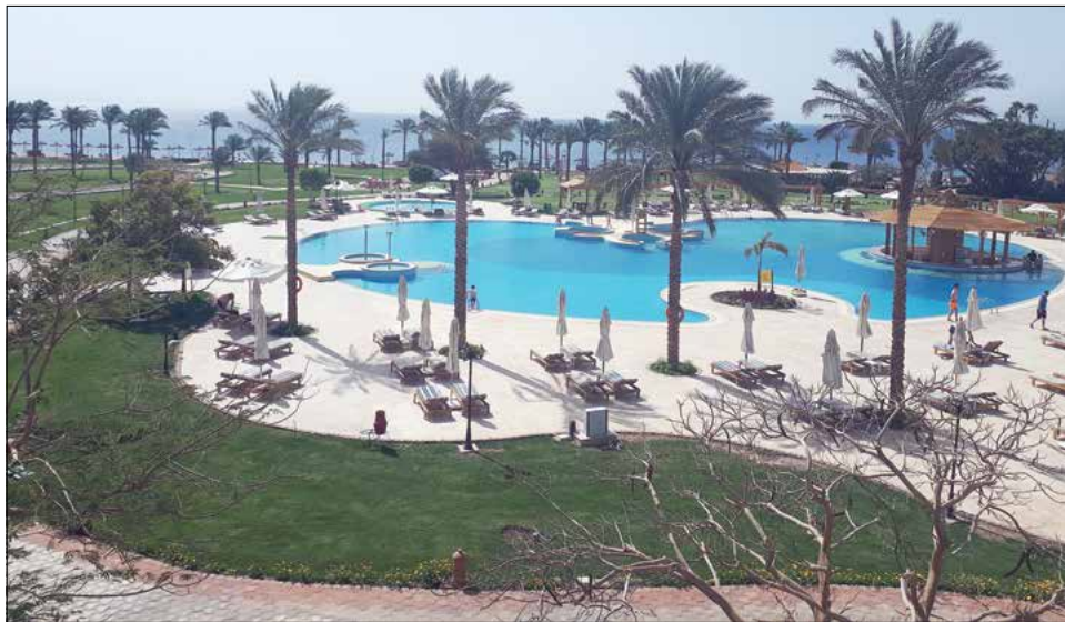
Vaizdas iš viešbučio.

Nors vietovė alsavo ramybe, vis dėlto vienu metu teko patirti įtampos. Vieną naktį prabudino keistas garsas – lyg kas šaudytų iš patrankų. Bumbasėjo kalnuose. Akimirksniu pervėrė nerimas: negi prasidėjo karas? Prišokus prie lango, viešbučio teritorijoje nebuvo jokios sumaišties: raibuliavo baseino vanduo, švytėjo naktiniai žibintai, kieme nesimatė nė gyvos dvasios... Teko gerokai pasivartyti lovoje laukiant išauštančio ryto ir vis pasvarstant, ką reikės daryti,