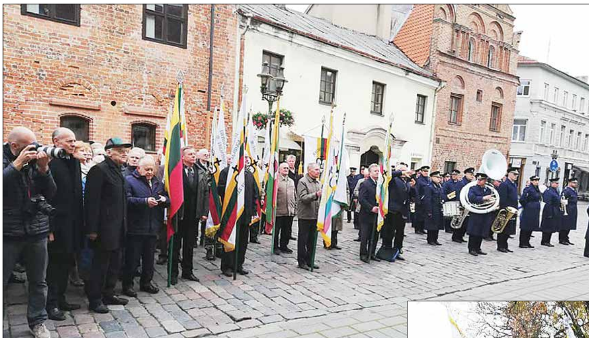
Iškilmės prasidėjo Kauno senamiestyje.